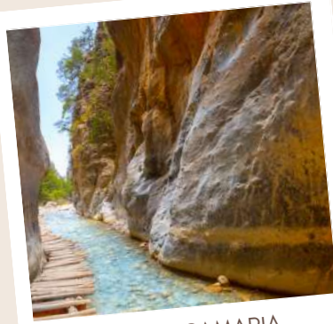
GORGES DE SAMARIA