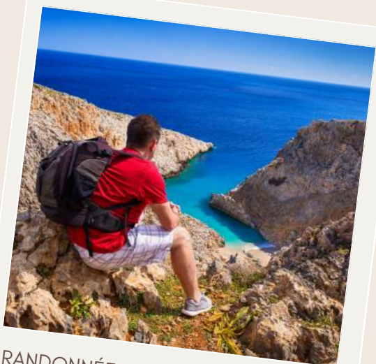
RANDONNÉE SUR LA CÔTE