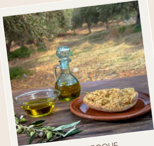
HUILE D'OLIVES GRECOUE