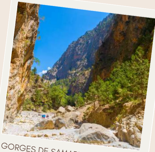
GORGES DE SAMARIA